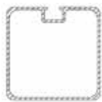
Słupy aluminiowe Profil standardowy 80x80 mm