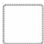
Słupy stalowe Profil 80x80 mm