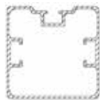
Słupy aluminiowe Profil wzmocniony, żebrowany 80x80 mm